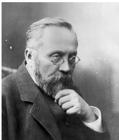
Napoleon Cybulski (1854–1919). Urodził się w Krzywonosach w obwodzie witebskim. Studiował medycynę w Akademii Wojskowo-Medycznej w Petersburgu. Tam też doktoryzował się. Od 1885 roku do końca życia pracował na Uniwersytecie Jagiellońskim, gdzie kierował Katedrą Fizjologii, był dziekanem Wydziału Lekarskiego, prorektorem i rektorem. Jest uważany za twórcę krakowskiej szkoły fizjologicznej. Jedna z krakowskich ulic nosi jego imię.