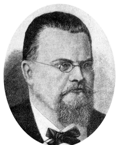
Zygmunt Wróblewski (1845–1888). Studiował fizykę w Kijowie, Berlinie i Heidelbergu. Doktorat uzyskał w Monachium. Od 1882 roku profesor Uniwersytetu Jagiellońskiego. W 1883 roku, razem ze Stanisławem Olszewskim, stosując kaskadową metodę skraplania gazów, jako pierwsi na świecie skroplili tlen ( -183^{\circ}\text{C} ) i azot ( -195^{\circ}\text{C} ). Rekordową temperaturą, jaką osiągnęli to -225^{\circ}\text{C} , co nie wystarczyło do skroplenia helu.

Archiwum Noblowskie ujawnia informacje o osobach nominowanych i nominujących po 50 latach. Nominujący dzielą się na stałych i zaproszonych okazjonalnie. Stałymi są m.in. dotychczasowi laureaci oraz członkowie Królewskiej Szwedzkiej Akademii Nauk. Okazjonalnymi są przedstawiciele wybranych w danym roku uczelni. Na przykład w 1996 roku profesorowie Wydziału Fizyki Uniwersytetu Warszawskiego (w tym piszący te słowa) otrzymali prośbę o nominację do Nagrody Nobla z fizyki. Już za niecałe 30 lat dowiemy się, jakie kandydatury zostały zgłoszone i przez kogo. Decyzje Szwedzkiej Akademii pozostają czasem nieodgadnione – na przykład okazało się, że wielki Dymitr Mendelejew był dziewięciokrotnie nominowany w latach 1905–1907 do Nagrody Nobla z chemii... i jej nigdy nie otrzymał.