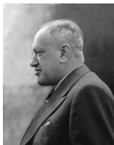
Leopold Infeld (1898–1968). Studiował i doktoryzował się na Uniwersytecie Jagiellońskim. Habilitował się w Uniwersytecie Lwowskim. Przez dwa lata pracował u Maxa Borna w Cambridge. Od 1936 roku współpracował z Albertem Einsteinem w Instytucie Studiów Zaawansowanych w Princeton. W latach 1938–1950 był profesorem Uniwersytetu w Toronto. Od 1950 roku pracował na Uniwersytecie Warszawskim, gdzie stworzył Instytut Fizyki Teoretycznej.