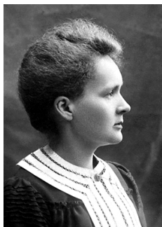
Maria Skłodowska-Curie (1867–1934). Studiowała i doktoryzowała się na Sorbonie w Paryżu. Była profesorem Sorbony od 1906 roku. Wprowadziła pojęcie promieniotwórczości. Jako jedyna kobieta otrzymała dwukrotnie Nagrodę Nobla: w 1903 roku z fizyki i w 1911 roku z chemii. Jest, jak dotąd, jedyną kobietą pochowaną w paryskim Panteonie.