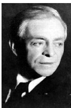
Kazimierz Funk (1884–1967). Studiował w Genewie i Bernie. Doktoryzował się w Bernie. Pracował w Instytucie Pasteura w Paryżu, na Uniwersytecie Berlińskim, w Instytucie Listera oraz w Cancer Hospital Research Institute w Londynie i na Uniwersytecie Columbia w Nowym Jorku. W latach 1923–1928 kierował oddziałem biochemicznym Państwowego Instytutu Higieny w Warszawie. W 1939 roku wyemigrował do USA, gdzie pozostał do końca życia. Od 1940 roku był szefem fundacji Funk Foundation for Medical Research.