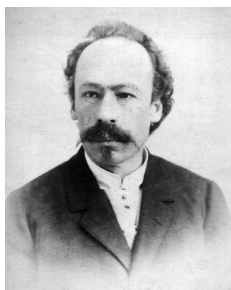
Karol Stanisław Olszewski (1846–1915). Studiował chemię i fizykę w Krakowie i Heidelbergu, gdzie doktoryzował się. Od 1876 roku profesor Uniwersytetu Jagiellońskiego.