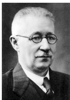
Wojciech Świątosławski (1881–1968). Studiował i doktoryzował się w Kijowie. Od 1912 roku był docentem na Uniwersytecie Moskiewskim. Od 1919 roku był profesorem Politechniki Warszawskiej. Wykładał również na Uniwersytecie Warszawskim. W latach 1928–1932 był prorektorem i rektorem Politechniki Warszawskiej. W latach 1935–1939 był senatorem RP i ministrem wyznań religijnych i oświecenia publicznego. Lata 1940–1946 spędził w USA na zaproszenie National Bureau of Standards. Po powrocie do Polski pracował na Politechnice i Uniwersytecie Warszawskim; utworzył Instytut Chemii Fizycznej PAN.