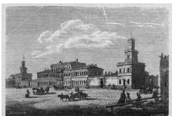
Dworzec kolei żelaznej warszawsko-wiedeńskiej w Warszawie

Początków kolei na ziemiach polskich możemy doszukiwać się na Górnym Śląsku, gdzie w latach 1798–1802 wybudowano wąskotorową konną kolej przemysłową, która połączyła Hutę Królewską pod Chorzowem z szybami kopalni Król . Natomiast pierwszą linią normalnotorową na obecnych ziemiach polskich było połączenie Wrocławia z Oławą oddane do użytku 22 maja 1842.